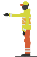
Stoppen als je de verkeersregelaar van rechts nadert