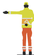
Stoppen als je de verkeersregelaar van achteren nadert