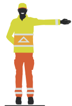
Stoppen als je de verkeersregelaar van voren nadert