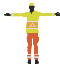
Stoppen voor zowel het verkeer dat van voren als van achteren komt